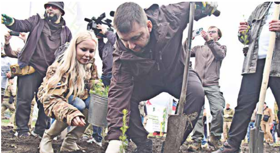
Денис Пушилин принял участие во всероссийской акции

В среду, 12 апреля, врио Главы ДНР Денис Пушилин в рамках федеральной акции «Сад памяти» принял участие в высадке деревьев на территории мемориального комплекса «Саур-Могилы». В мероприятии также участвовали политики и общественные деятели Ленинградской области и ДНР.