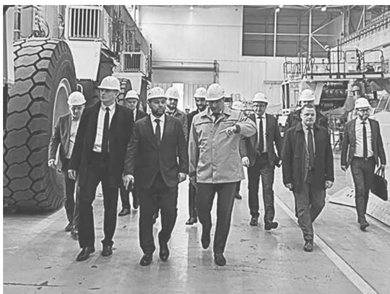
Делегация ДНР посетила завод «БелАЗ»

«Первое, что на повестке, – обстрелы жилых районов, включая и сам Донецк. Но не только обстрелами сейчас можно характеризовать ситуацию в ДНР. Безусловно,