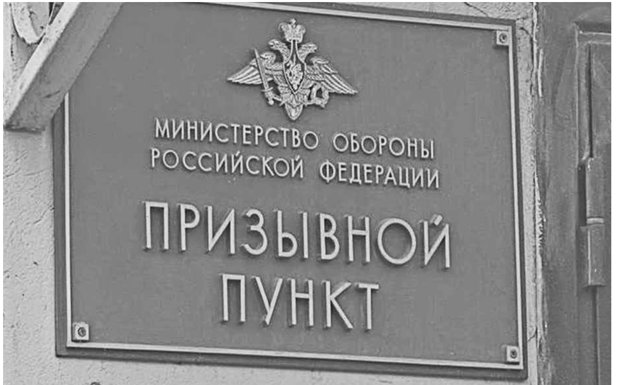
Призывники будут поставлены на учет, но в войска не поедут

Здесь же можно уточнить военно-учетные данные и встать на воинский учет в соответствии с действующим законодательством