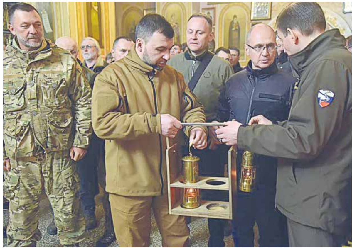
Благодатный огонь в донецком храме

Благодатный огонь сошел в Великую субботу в Кувуклии – часовне в центре храма Воскресения Христова (храма Гроба Господня) в Иерусалиме. Верующие считают, что Благодатный огонь символизирует присутствие и воскрешение Иисуса Христа.